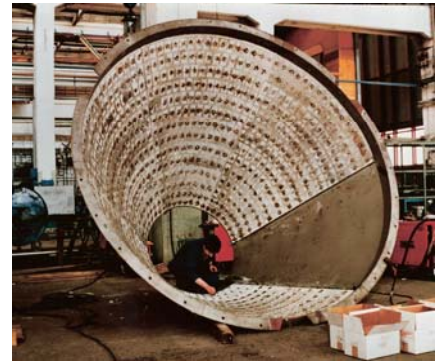
Cono classificatore per mulino

Negli impianti di movimentazione di prodotti abrasivi quali carbone, cemento, silice, quarzo, ecc. per alcuni loro componenti, allo scopo di prolungarne la vita, si rende necessario il rivestimento o corazzatura in ceramica antiusura.